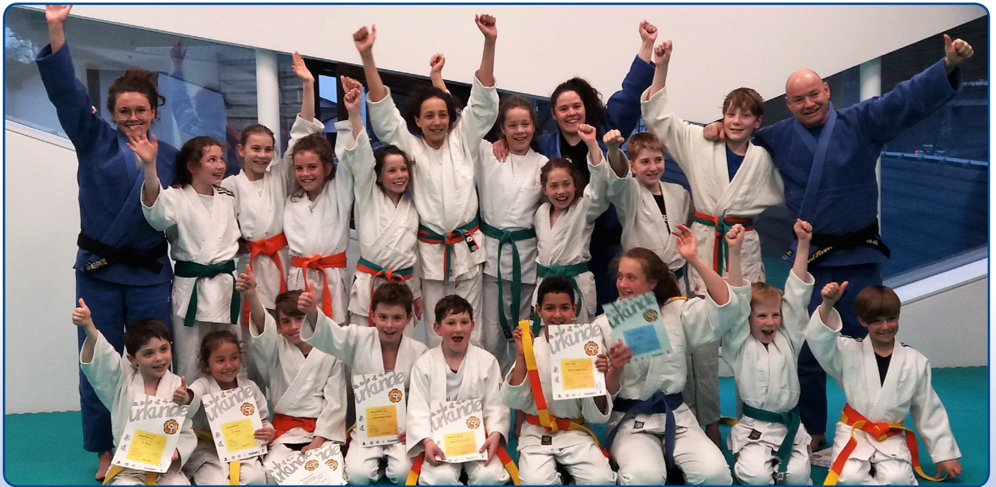
Strahlende Gesichter bei der Gürtel- bzw. Diplomverleihung Gürtelprüfung 2018 der Judokids (Wettkampfgruppe).