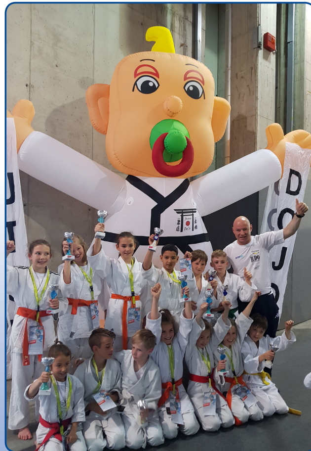
so sehen glückliche Sieger aus !!