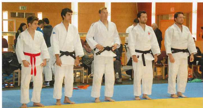
Großartig der Einsatz, hervorragend das Ergebnis

Team Südtirol besiegte im ersten Halbfinale Kuroki Tarcento knapp mit 6:4, Innsbruck wies JK Vicenza mit 9:1 klar in die Schranken. Im Keinen Finale drehte JK Vicenza den Spieß um und revanchierte sich gegen Tarcento mit einem 7:3 Sieg und sicherte sich Bronze. Bei der alles entscheidenden „Finalissima“ JZ Innsbruck gegen die Südtirol- Auswahl – beide Teams hatten bis zum Ende des letzten Spieltag keine Niederlage einstecken müssen – ging es hart auf hart. Beim „Halbzeitstand“ von 2:3 war noch alles offen, leider ging auch der Rückkampf mit einem 3:2 an das JZ Innsbruck.