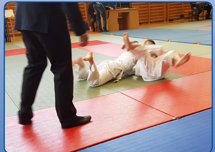
Kurts Truppe beim Kämpfen um die besten Platzierungen.