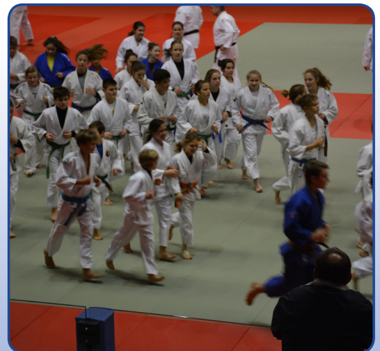
Lorenzner und Rodenecker Nachwuchsjudokas.